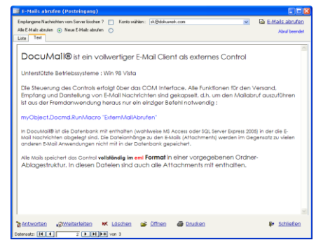
Text einer empfangenen Mail

Auch der Versand einer Email lässt sich mit nur einer Codezeile realisieren :